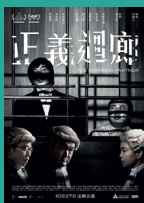
《正義迴廊》 香港電影金像獎 新晉導演