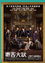
《毒舌大狀》 香港電影金像獎 最佳電影