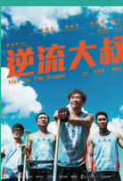
《逆流大叔》 華鼎獎 中國香港最佳電影