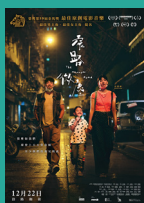
《窄路微塵》 香港電影評論學會 最佳導演