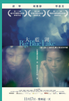
《大藍湖》 香港電影金像獎 新晉導演